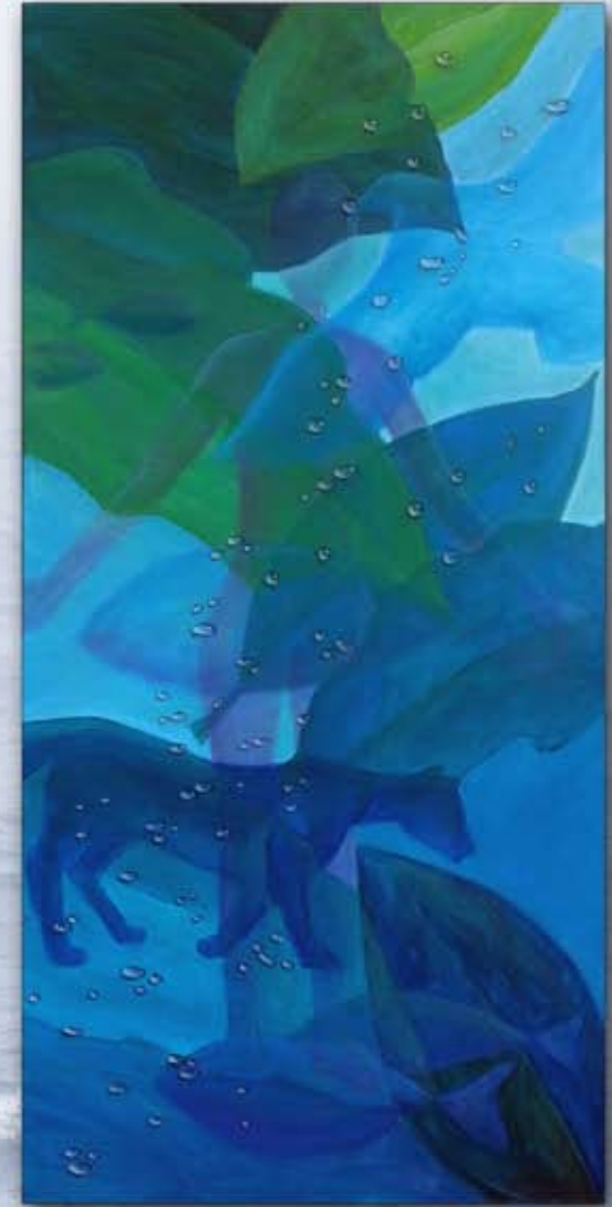
Wasser ist Leben Acryl auf Leinwand 100 x 50 cm