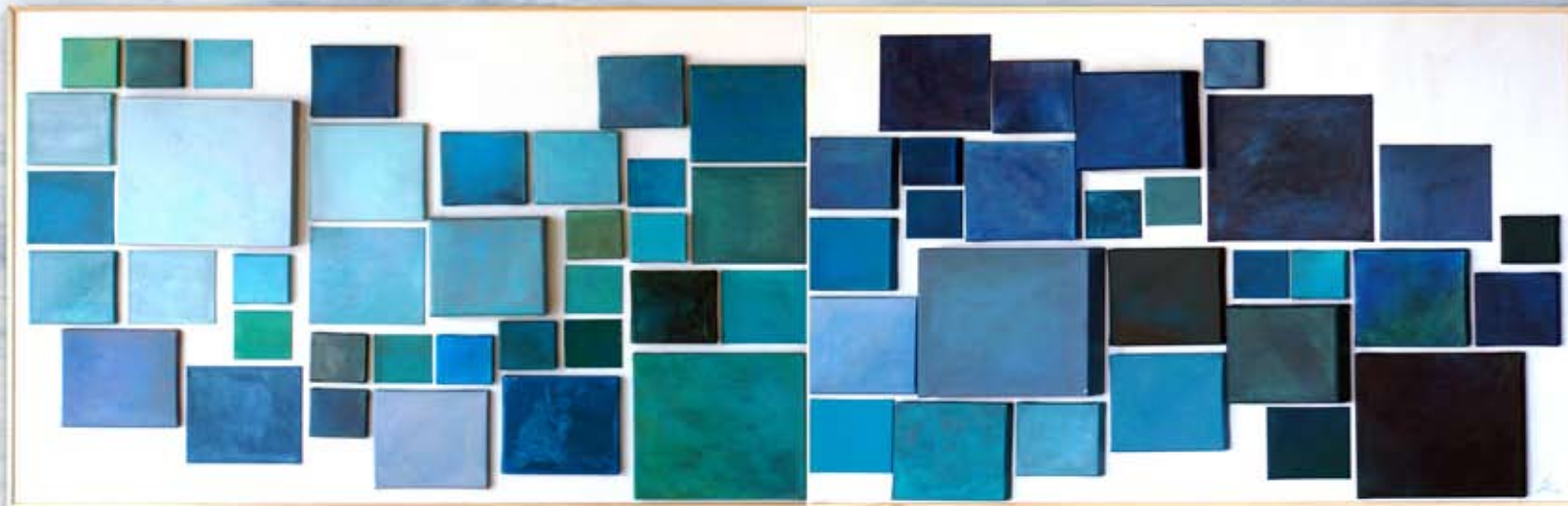
Farben des Wassers

Acryl auf Leinwänden auf zwei Platten ges. 290x110cm