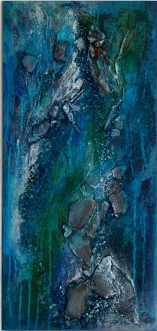
Lebendiges Wasser Acryl und Materialmix auf Leinwand jeweils 80 x 40 cm