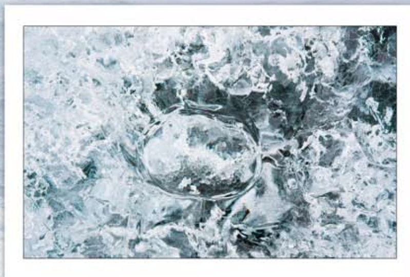
Digitalprint, 40 x 60 cm