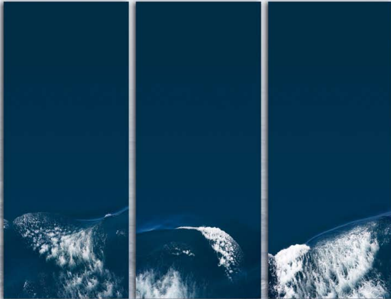
Wellen (Nordatlantik), 3 Fahnen, Digitalprint auf beschichtetem Gewebe, je 200 x 80 cm