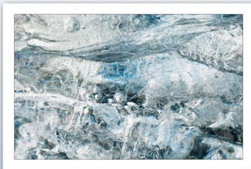
Jahrtausende altes Eis vom Jökulsarlon (Island)