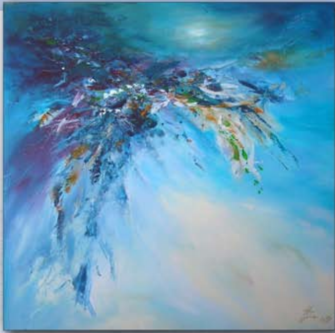
Ursprung des Lebens